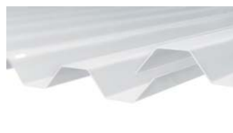
3. gop Esslon® takplast